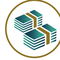
استقبال وتوزيع الزكاة