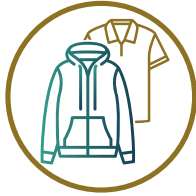
استقبال الملابس المستعملة