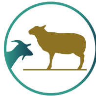
استقبال لحوم الهدى والأضاحي