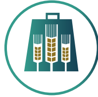
استقبال وتوزيع زكاة الفطر