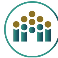
رعاية الأسر المحتاجة