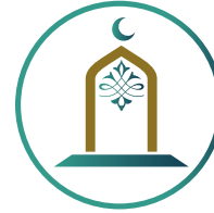
خدمة بيوت الله