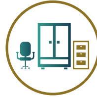
استقبال وتوزيع الأثاث المستعمل